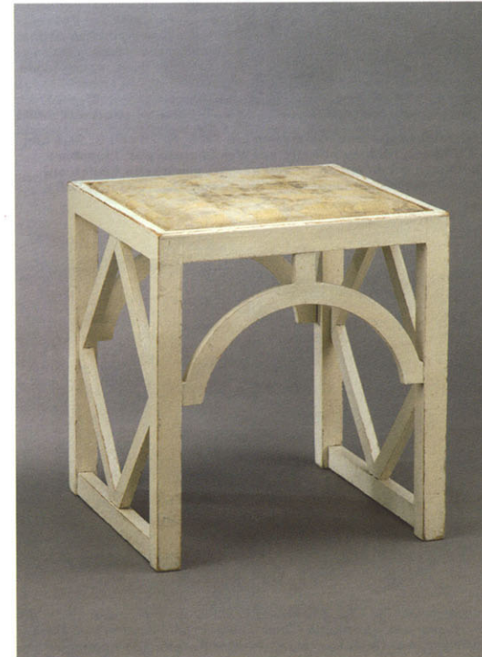
Josef Hoffmann, Hocker Stool 1904, Wiener Werkstätte, Holz, weiß lackiert, Bezug „Lange Ohren“, Wohnung Wittgenstein-Stonborough, Berlin, Wiener Werkstätte

Die Einrichtungen, die die Wiener Werkstätte geschaffen hat, und ihre Bestandteile sind heute - auch als Folge der Vertreibung ihrer Eigentümer aus Österreich und nach der Machtübernahme durch die Nationalsozialisten - über die ganze Welt verstreut. Und der Kunsthandel hat ab etwa 1970, als die Qualität und künstlerische Bedeutung dieser Arbeiten erkannt worden ist, das Seine dazu beigetragen.