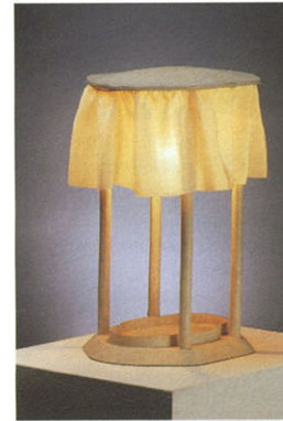
Josef Hoffmann Nachtschlampe Bedside lamp um c. 1909 Wiener Werkstätte Eisenblech, weiß gestrichen Wiener Werkstätte

höchster Perfektion, immer aus den besten Materialien und immer in einer höchsten Ansprüchen genügenden Verarbeitungsqualität.