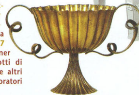
In alto: spilla di Josef Hoffmann. Qui sopra: tavolino del 1916-17. A sinistra: centrotavola di Hoffmann.