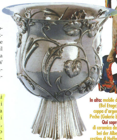
In alto: mobile di Josef Hoffmann (Bel Etage). A sinistra: coppa d'argento di Dagobert Peche (Galerie bei der Albertina). Qui sopra: scultura di ceramica del 1927 (Galerie bei der Albertina). Sotto: cestino di Hoffmann (Bel Etage).