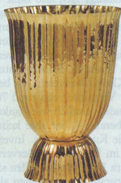
Josef Hoffmann/Wiener Werkstätte: Messingfußvase, 1928, Messing gehämmert, H: 19,5 cm, 24.000 Euro.

Sollten Sie zwischen 15. und 24. September in Paris zu tun haben, gilt es, einen Pflichttermin zu wahren: Die Antiquitätenmesse Biennale des Antiquaires lockt im Grand Palais. Österreich ist dort durch Bel etage mit einem opulenten Jugendstil- und Wiener-Werkstätten-Programm vertreten (Wien 1, Mahlerstraße 15, Tel.: 01/512 23 79, www.beletage.com , in Paris auf Stand 34 zu finden). Keiner der prominenten Namen fehlt: Josef Hoffmann und Kolo Moser, Adolf Loos und Otto Wagner – auch in Wien zu sehen vor und nach dem Pariser Event.