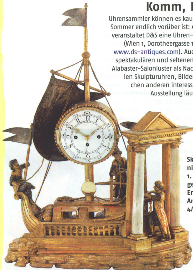
Skulpturuhr „Venezianisches Handelsschiff“, 1. Viertel 19. Jh., Holz geschnitzt, blattvergoldet, Email-Zifferblatt, Ankergang, Wiener 4/4-Schlag, H: 64 cm.