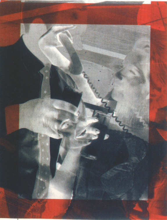
Karl Anton Fleck: o. T., 1965–69, Filmmontage, Fotografie (Auflage: je 5) 66 x 49 cm, 840 Euro.

In der Zeit zwischen 1965 und 1969 beschäftigte sich der Maler und Grafiker Karl Anton Fleck intensiv mit den Medien Film und Fotografie. Zeit seines Lebens entzog sich der 1983 im Alter von 55 Jahren verstorbene Künstler jeglicher Kategorisierung, und so verhält es sich auch bei seiner Auseinandersetzung mit bewegten und unbewegten Bildern. Zwischen konzeptueller Fotografie und Experimentalfilm hat Fleck sehr eigenwillige Werke geschaffen – Collagen aus Filmkadern und eigenen Fotos, die wie Doppelbelichtungen und Überlagerungen wirken. Fleck hat diese Werke zu Lebzeiten nicht veröffentlicht, sie fanden sich im Nachlass. Die Galerie Chobot (Wien 1, Domgasse 6, Tel.: 01/512 53 32, www.kunstnet.at/chobot ) zeigt diese ausgefallenen Blätter.