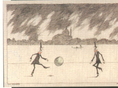
Paul Flora: „Das Ballspiel“, 2006, Federzeichnung, 21 x 32 cm, 2250 Euro.

Charmant, skurril, feinfühlig – Paul Floras Welt passt irgendwie zum Weihnachtsfest, und so widmet die Galerie Gerersdorfer (Wien 9, Währinger Str. 12, Tel.: 01/310 84 84, www.gerersdorfer.at ) dem sympathischen Künstler schon seit mehreren Jahren im Advent eine große Verkaufsausstellung. Neue Arbeiten des Tiroilers dürfen da ebenso wenig fehlen wie der schon zur Tradition gewordene Flora-Kalender, der um 25 Euro einen kurzen Abriss des jüngeren Schaffens bietet.