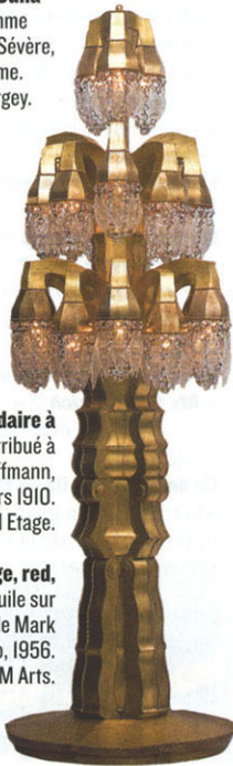
Lampadaire à 24 bras attribué à Josef Hoffmann, Vienne vers 1910. Galerie Bel Etage.