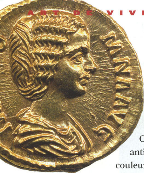
Aureus de Julia Domna , femme de Septime Sévère, frappé à Rome. Sabine Bourgey.