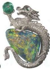
Broche en platine , opale, diamants et émeraudes de la maison Cartier.