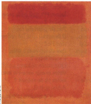
« Orange, red, yellow », huile sur toile de Mark Rothko, 1956. Galerie L & M Arts.