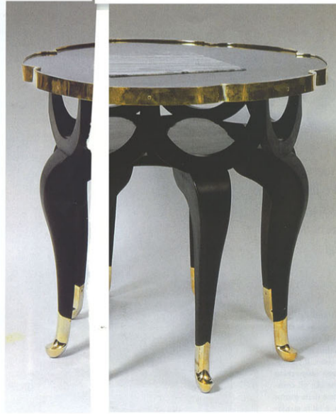
Da sinistra: orologio da tavolo in ceramica di Michael Powolny, disegnato nel 1907-8 e prodotto da Verelinge Wiener und Gundner Keramik dopo il 1912 (da Bel Etage); tavolo di Adolf Loos e Friedrich Otto Schmidt, 1900 circa, in mogano, ottone dorato e marmo (da Bel Etage). Sotto, da sinistra: cabinet di Josef Maria Olbrich, disegnato nel 1905 circa, venduto da Dorotheum per 24mila euro nel novembre 2006; coppa di vetro di Josef Hoffmann, 1914 eseguita da Lötzt, 31.700 euro da Dorotheum nel novembre 2002; poltrona di Otto Wagner realizzata per l'Esposizione parigina del 1900 (da Yves Macaux).