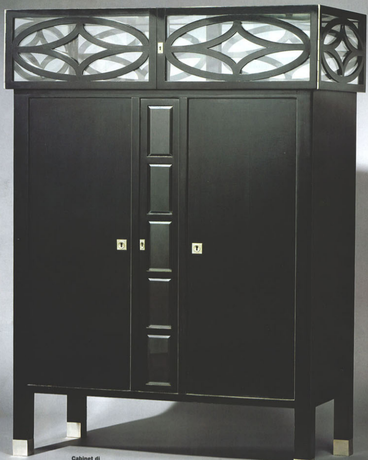
Cabinet di Koloman Moser per la Wiener Werkstätte, 1904, in acero tinto (da Yves Macaux).