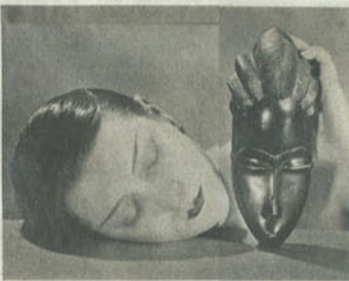
Dialog der Gesichter: Man Rays berühmtes Foto „Noire et Blanche“ aus dem Jahr 1926, 18 mal 23,2 cm, bei Kicken aus Berlin für 600 000 Euro