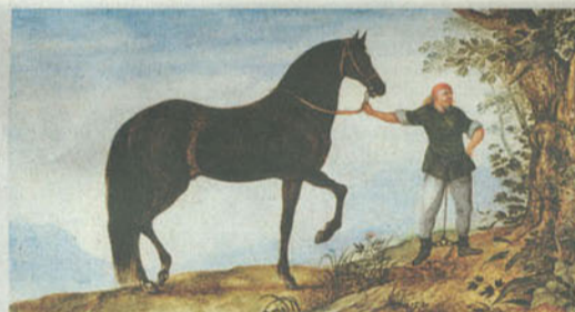
Lieblingssperd von Rudolf II: Roeland Saverys „Schwarzer Hengst mit Knecht“ aus dem Jahr 1605, Öl auf Holz, 22,8 mal 43,3 cm, bei De Jonckheere aus Paris für 600 000 Euro