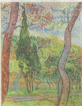
Farbgewaltig: van Goghs „Park des Saint-Paul-Hospitals“ von 1889 bei Dickinson für 25 Millionen Euro

Gustav Klimts kleiner Bruder Ernst hat bei den Jubiläumsauktionen von Im Kinsey in Wien für eine Überraschung gesorgt. Wer sonst noch Erfolg hatte... Seite 44