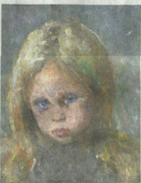
Kinderblick: Edvard Munchs „Kopf eines Mädchens“ von 1885 bei Daxer & Marschall für 780 000 Euro Foto Daxer & Marschall