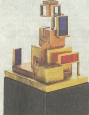
Türmchen: Naum Slutzkys „Bauhaus-Studie mit Kuben“, nur 7 cm hoch, bei Fiedler aus Berlin für 78 000 Euro