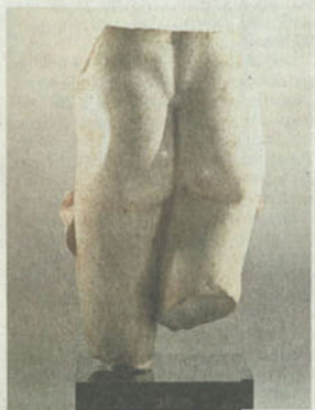
Wohlgeformt: Fragment einer Aphrodite, römisch, 68 cm hoch, bei Cahn aus Basel für 240 000 Franken