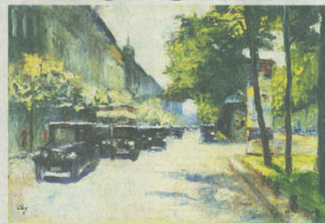
Lesser Ury, „Unter den Linden“ Öl auf Leinwand, um 1925, 35,4 x 50,4 cm, signiert