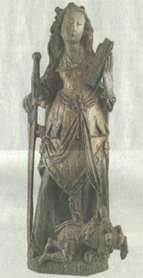
Siegessicher: heilige Katharina aus Brabant, um 1520, 68 cm hoch, bei Senger aus Bamberg für 220 000 Euro