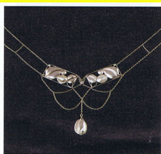
Kollier , Entwurf Josef Hoffmann (1870–1956) für die Wiener Werkstätte, um 1909, Silber, Perlmutter; Galerie Bel Etage , Wien

Dieses Halsband dagegen hat keine Revolution ausgelöst. Aber zumindest war es mit einem epochalen Umschwung verbunden: Mit der Verlagerung des Augenmerks vom rein materiellen Wert des Schmuckstücks auf seine formale Gestaltung, wie er typisch ist für die Epoche des Jugendstils. Josef Hoffmann, der Großmeister des Wiener Jugendstils, hat dieses sehr elegante Halsband mit Anhänger um 1909 entworfen, und in der Wiener Werkstätte wurde es aus vergoldetem Silber und Perlmutter hergestellt. Man kann dieses exquisite Objekt auf der diesjährigen Tefaf in Maastricht bestaunen, in der noch jungen Design-Sektion, die erst vor zwei