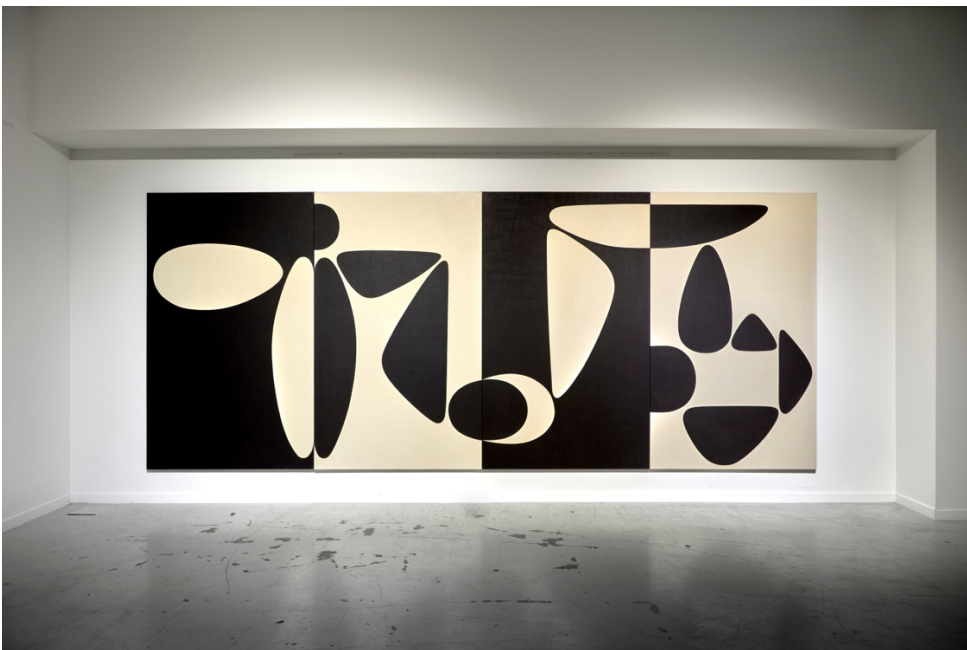
Victor Vasarely, Ha-Ko-Da-Te, 1953, Huile sur toile, 220 x 535 cm (4 panneaux de 220 x 130 cm chacun)

La galerie David et Isabelle Levy , établie à Bruxelles et à Paris, se spécialise dans l'avant-garde européenne du XXe siècle. Elle présente une pièce emblématique de Victor Vasarely créée en 1953 et issue de la série « Belle Isle ». Ha-Ko-Da-Te est l'un des exemples les plus significatifs des premières compositions de Victor Vasarely, où il active la surface avec des unités géométriques répétées et des altérations de motifs en noir et blanc. Cette œuvre abstraite et géométrique, liée à l'Op art, et mesurant 220 x 535 cm a été immortalisée dans une séance de mode pour la couturière et femme d'affaires française Jeanne Lanvin. Cette œuvre, appartenant pendant près de 30 ans à la collection du Louisiana Museum of Art au Danemark, a été exposée au Salon des Réalités Nouvelles à Paris l'année de sa création. Ensuite dans une collection privée de Genève, cette pièce monumentale sort de l'ombre pour la première fois depuis 1990.