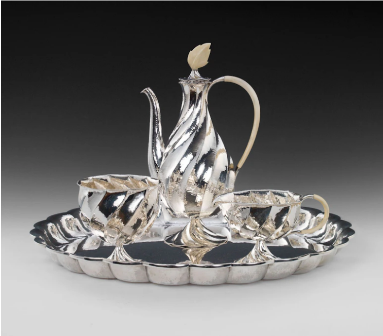
Dagobert Peche, Service à café en argent 900, Wiener Werkstätte, Vienne, 1920 Cafetière, pot à lait, sucrier, plateau ovale

Wiener Werkstätte, fondée en 1903, est connue pour la géométrie stricte et vigoureuse de ses premières créations. Peche, qui a travaillé comme designer à Wiener Werkstätte entre 1915 et 1923 a joué un rôle clé dans le développement d'une esthétique fusionnant le baroque, le rococo et l'art populaire orné de motifs floraux. À la mort de Peche, Josef Hoffmann le salue comme le "plus grand ornemaniste".